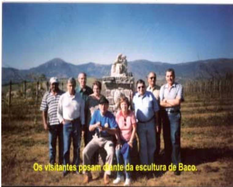
Os visitantes posam diante da escultura de Baco.