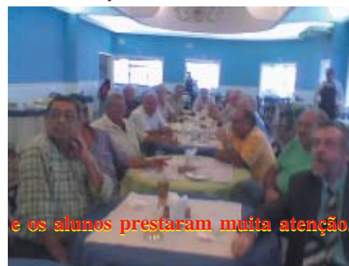
e os alunos prestaram muita atenção.