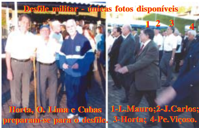
Desfile militar - únicas fotos disponíveis

palco e, encarando a grande plateia, recitou um poema de sua autoria. O dia 22 de maio foi reservado para a cerimônia militar à tarde e o baile à noite. Na solenidade, presidida pelo Comandante da Aeronáutica, Ten.-Brig. Juniti Saito, foram homenageados ex-comandantes da Escola e personalidades civis, entre as quais nosso amigo Gino Calvi. Como de praxe, militares foram agraciados com medalhas e diplomas de mérito. E, para encerrar, foi comandado o desfile da tropa, em que o grupamento de ex-alunos se destacou pela grande emoção de seus integrantes ao retornarem à origem, para unirem-se aos jovens alunos, a entoar a canção: "Somos da Escola Preparatória de Cadetes do Ar..." Logo após a solenidade, o Comandante da Aeronáutica foi convidado a descerrar uma placa em homenagem à Escola, na ante-sala do Gabinete do Comando, oferecida pela Associação dos Ex-Alunos da Escola Preparatória de Cadetes do Ar (AEPCAR).