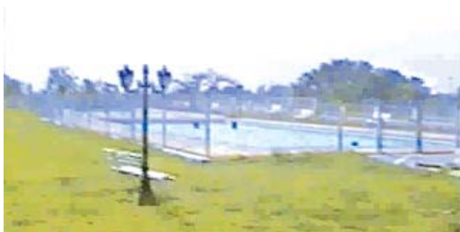
Vista parcial do Centro Sócio-Desportivo