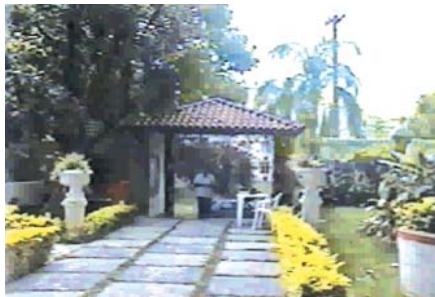
Um dos belos recantos da Vila dos Suboficiais e Sargentos