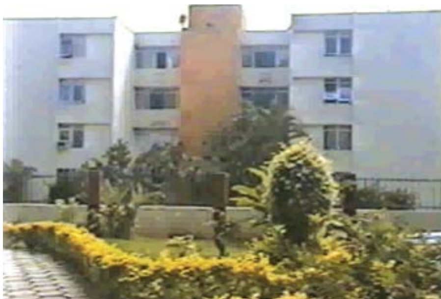
O verde valoriza as áreas residenciais