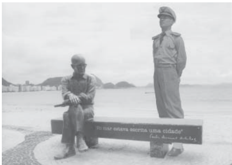
Jovem Aluno da EPCAR contempla o horizonte dos seus mais sublimes sonhos, sob o olhar tolerante da recém-inaugurada estátua de Drummond.