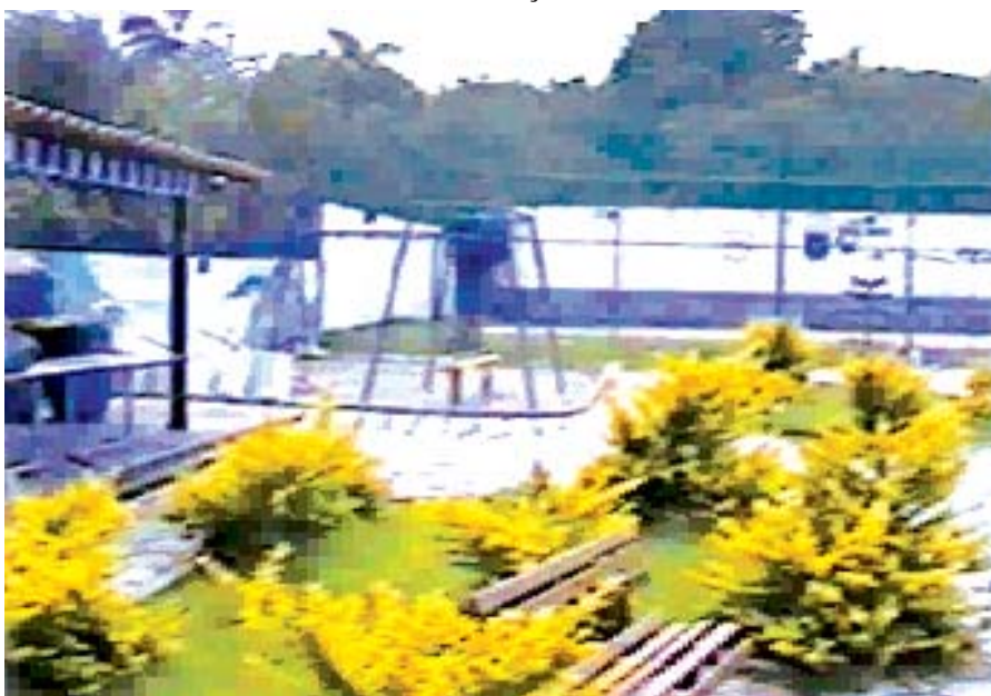
Bar e playground junto à piscina