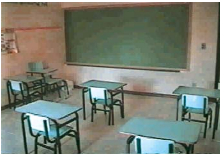
Sala de alfabetização da creche

Somos muito gratos pelo seu convite, Coronel Norival. Receba e transmita a seus comandados os cumprimentos da Turma 57-BQ / Aspirante 62, pelo excelente trabalho desenvolvido em prol da família aeronáutica brasileira.