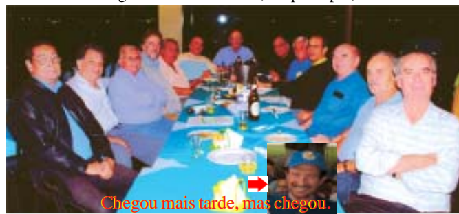
Chegou mais tarde, mas chegou.

Alô, pessoal, peço permissão para, novamente, ocupar um espaço do nosso jornalzinho para tratar de dois assuntos importantes. Aliás, tudo que se refere à Turma é importante, mas esses têm de ser colocados agora. Primeiramente, dizer que está sendo divulgado o nome dos colegas que, em 2009, estarão ingressando no seletivo “Clube dos Setentões”. Quanto àquela questão do encontro mensal do “cinquenta-e-sete-BQanos”, tornou-se oficial, também, o almoço no Clube de Aeronáutica. Recapitulando: Happy hour no Deck das Turmas – terças-feiras, a partir de 17:30h; Almoço de confraternização no restaurante geral – segundas-terças-feiras, com início às 12:00h. Se as datas dos eventos coincidirem com feriado, terão de ser remar cadas. Eu e o Amorim divulgaremos a nova data, em princípio, no mesmo mês.