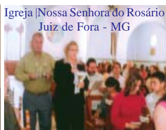
Igreja Nossa Senhora do Rosário Juiz de Fora - MG