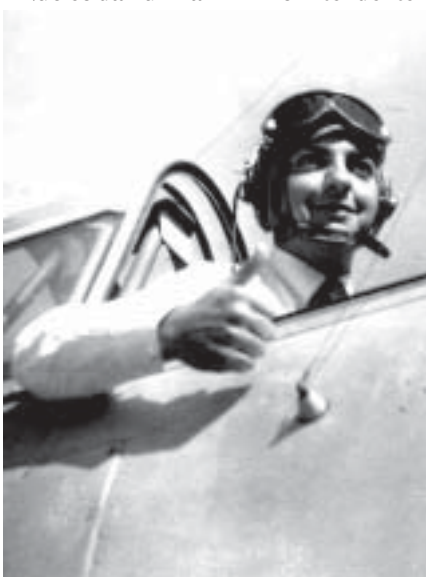
Al. 57-71, Sucupira Núcleo da Turma - Nasceu no Dia do Aviador!