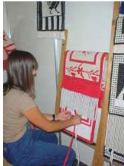
Artesanato - Tecelagem