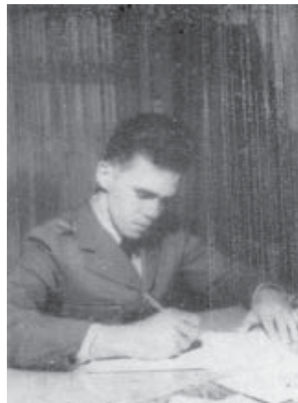
Cad. 57-095, Tujal "Cadete Veterano" - 1º Ano Intendente