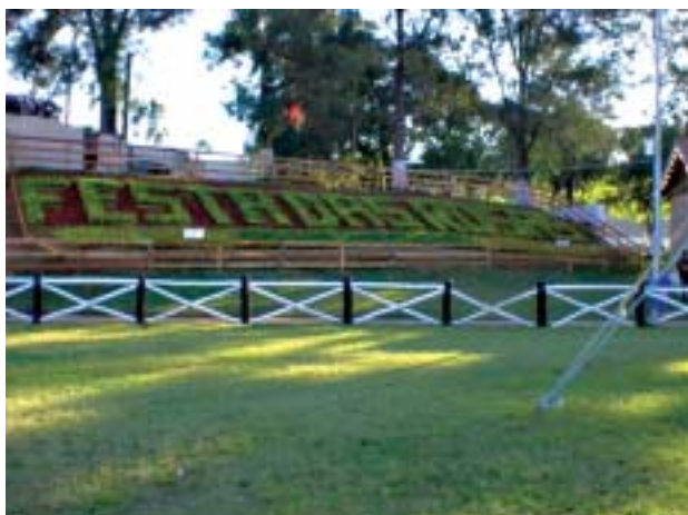
Canteiro do Pingo de Ouro - Acesso às arquibancadas