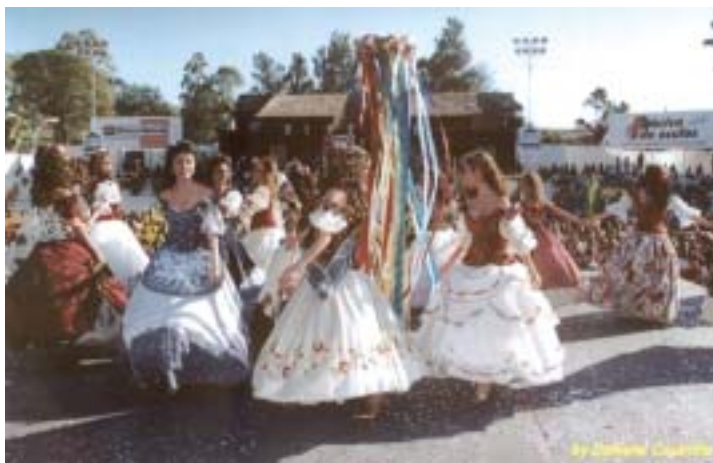
A Dança das Candidatas