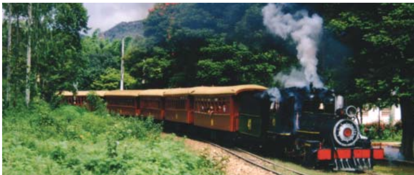
Maria-fumaça - tradição turística de Tiradentes - MG

Muitas pessoas embarcarão nesse trem apenas a passeio, outras encontrarão no seu trajeto somente tristezas e ainda outras circularão por ele prontas a ajudar quem precise. Vários dos viajantes quando desembarcam, deixam saudades eternas, outros tantos quando desocupam seu assento, ninguém nem sequer percebe.