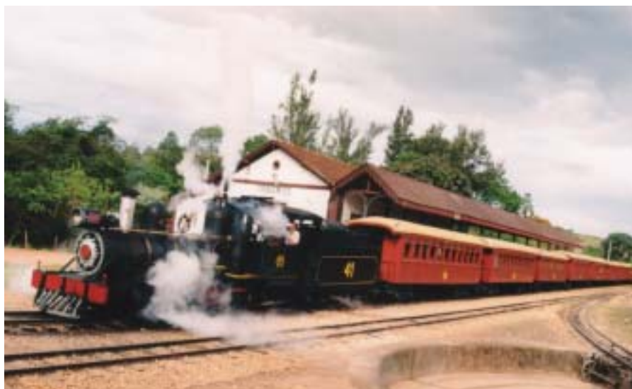
Outra vista do trem que une Tiradentes a São João del Rey (ver imagem na página 1)