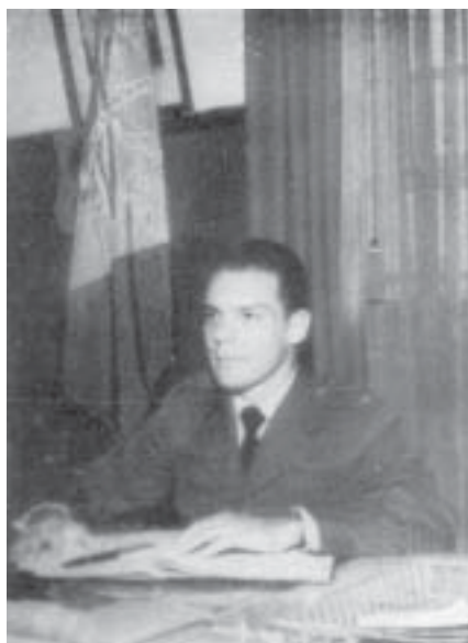
Al. 57-44, Montero Núcleo da Turma - 1º Ano Intendente