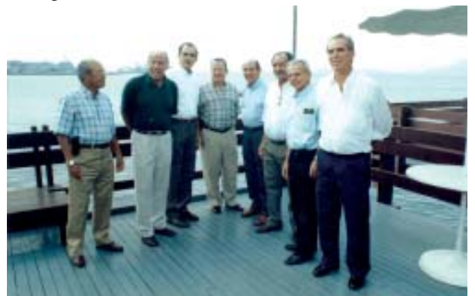
Companheiros no deque, um dos muitos ambientes agradáveis do Clube da Aeronáutica