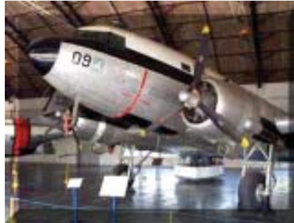
2009, o primeiro C-47 da FAB - Bom pra transportar pessoas, remédios e alimentos.

hangares, onde as velhas máquinas, cientes de seus deveres cumpridos, descansam em paz. Isoladamente, transitava por entre as Águias e, ao cumprimentá-las, de per si, lembrava dos companheiros que, no auge da vibração, fundiram suas massas corpóreas às fuselagens de suas congêneres. Parei diante do majestoso Douglas, C-47, e fiquei, por muito tempo,