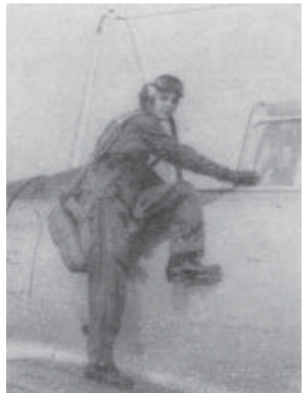
Al. 58-283, Archimedes "Pára-quedista" do 2º Ano