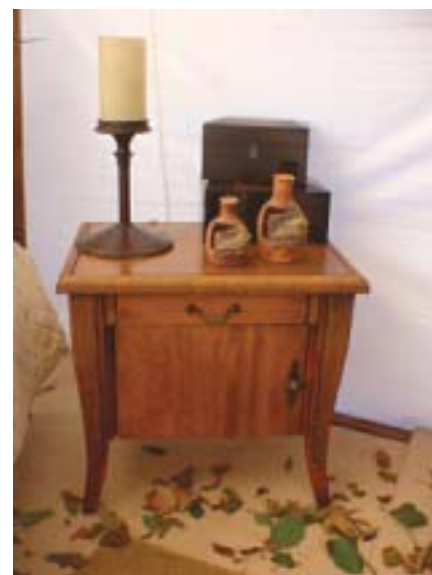
Artesanato - Móveis