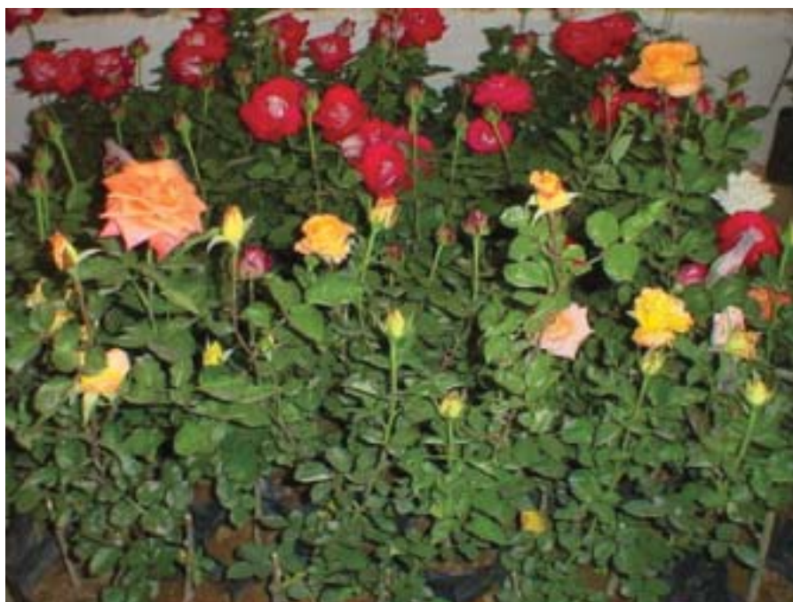
Rosas - As donas da Festa