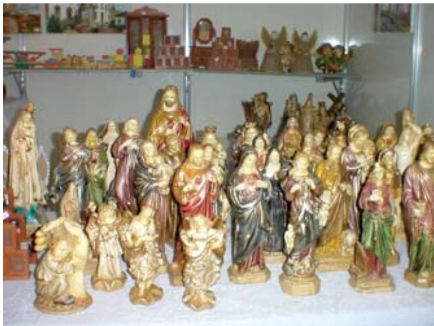
Artesanato - Santos barrocos

de outubro, naturalmente, foi dedicado a elas, tendo, como atrações, palhaços, malabaristas, bandinhas e diversas atividades recreativas. Crianças do Projeto TIM ArtEducação também participaram da Festa. Nesse dia, também desfilaram os Brotos (meninas de 3 a 7 anos) e os Superbrotos (de 8 a 12 anos), com seus lindíssimos vestidos estilizados. Não fossem as regras do concurso estabelecidas que deve ser escolhida uma rainha para cada faixa etária, todas as meninas deveriam ser coroadas, num "bem dirigido" empate em todos os quesitos, com grau máximo (assunto a ser pensado seriamente, a começar pela extinção do corpo de jurados). Mas "apostar" não foi o melhor verbo para definir o esforço dos organizadores.