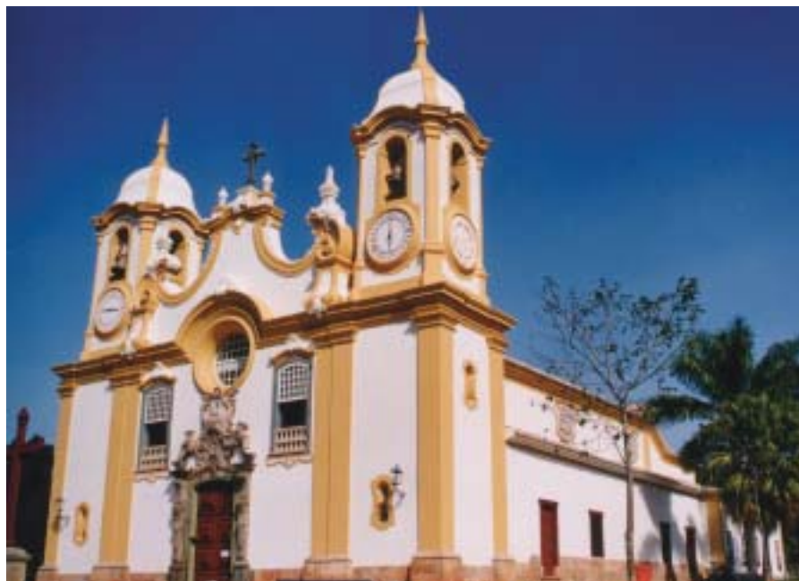
A Matriz de Santo Antônio, uma das mais belas, à espera dos Turistas da Turma