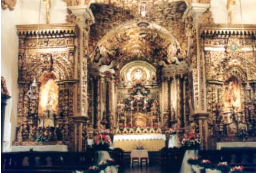
O riquíssimo altar-mor da Matriz de Santo Antônio

A equipe de reportagem de O Con*dor decidiu aproveitar uma folga durante a cobertura da Festa das Rosas e Flores para visitar a Cidade, registrando tudo em emocionante volta ao passado. Constatou que Tiradentes diferencia-se das demais cidades históricas pela presença de cavalos e charretes nas ruas. O Centro Histórico, calçado de pedras de tamanhos diversos, deve ser percorrido a pé, ainda que permitido o acesso do "estranho automóvel". No roteiro turístico, não pode deixar de ser incluído o Chafariz de São José, construído em 1749, com três fontes e uma imagem, em terracota, de São José das Botas. Já naquela época, havia preocupação dos governantes com