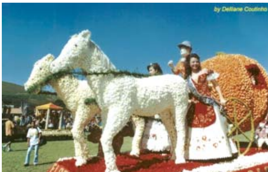
Cinderela - O carro alegórico vencedor