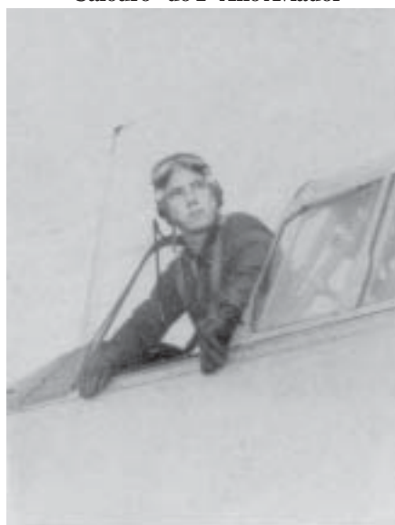
"Cadete" 62-107, Villagra Oficial-Aviador Paraguaio