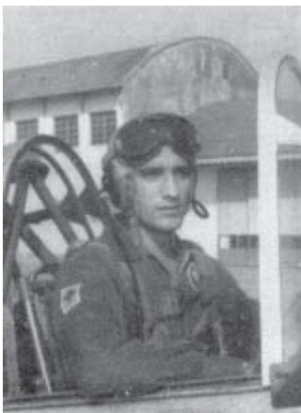
Al. 57-70, Andrade Núcleo da Turma